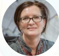
レスター大学 専門職連携教育 E.アンダーソン 教授